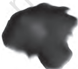
चित्र 3.3 : कोलतार।

यह एक अप्रिय गंध वाला काला गाढ़ा द्रव होता है (चित्र 3.3)। यह लगभग 200 पदार्थों का मिश्रण