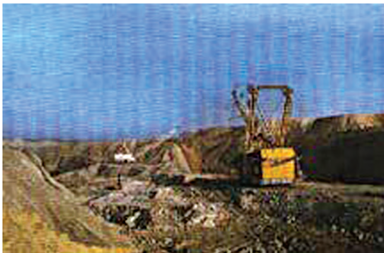
चित्र 3.2 : कोयले की एक खान।

वायु में गर्म करने पर कोयला जलता है और मुख्य रूप से कार्बन डाइऑक्साइड गैस उत्पन्न करता है।