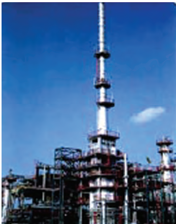
चित्र 3.5 : पेट्रोलियम परिष्करण।

को पृथक करने का प्रक्रम परिष्करण कहलाता है। यह कार्य पेट्रोलियम परिष्करण में सम्पादित किया जाता है (चित्र 3.5)।